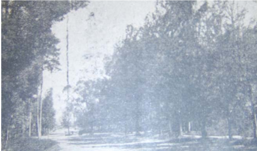
Imagen 3. Parque de la Escuela Granja San Rafael