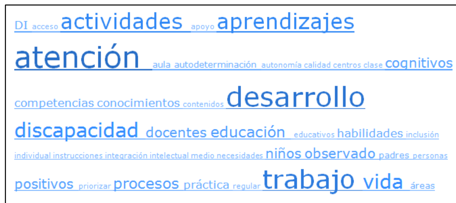
Figura 2. Nube de palabras mencionadas con mayor frecuencia

Una vez que se contó con la información categorizada, se identificaron aquellos conceptos de mayor relevancia para los estudiantes, para ello se utilizó la herramienta visual de nube de palabras, en la que se agrupan aquellos conceptos hallados más veces en el texto analizado. En la Figura 2 se pueden identificar los de mayor aparición.