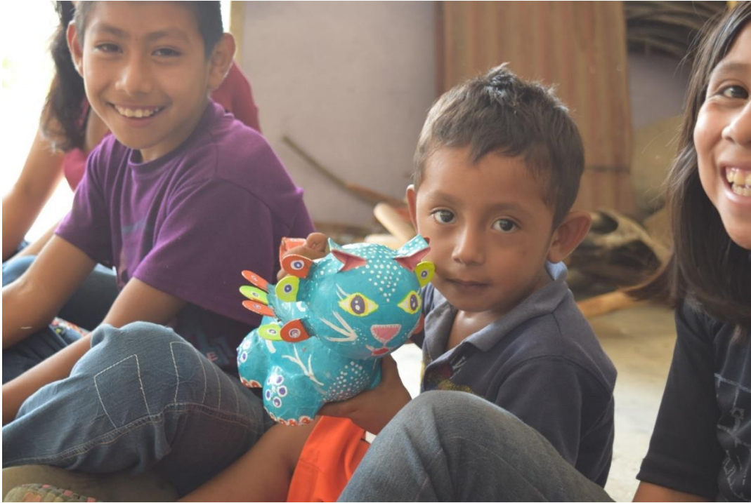
Fig- 4. Primer día de trabajo en el Ejido Josefa Ortiz de Domínguez. Niños conociendo los Alebrijes, dentro de la casa Ejidal. Reserva de la Biósfera La Sepultura. Chiapas, México

Cada participante eligió cómo formaría su obra. Escogieron animales de su localidad y uno fantástico, utilizaron materiales como papel, engrudo, pinceles, pinturas de diferente color, abatelenguas, los niños de Josefa aportaron materiales que consideraron útiles, cucharitas de madera, palitos de madera de diferente tamaño, cartón, semillas de maíz y frijol, ramitas de pino y encino. Cada niño hizo un boceto de su animal favorito, y seleccionaron las piezas que conformarían a su respectivo alebrije y comenzaron a cortar con las manos el papel para su alebrije.