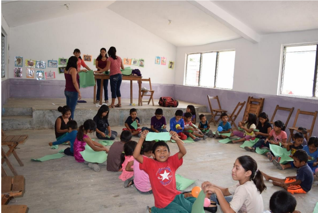
Fig. 5. Primera etapa en la creación de Alebrijes en el Ejido Josefa Ortiz de Domínguez

Los alumnos experimentaron con la textura y características del engrudo y sus componentes. Humedecieron el papel cortado previamente y colocaron la primera capa con engrudo a la estructura de su alebrije.