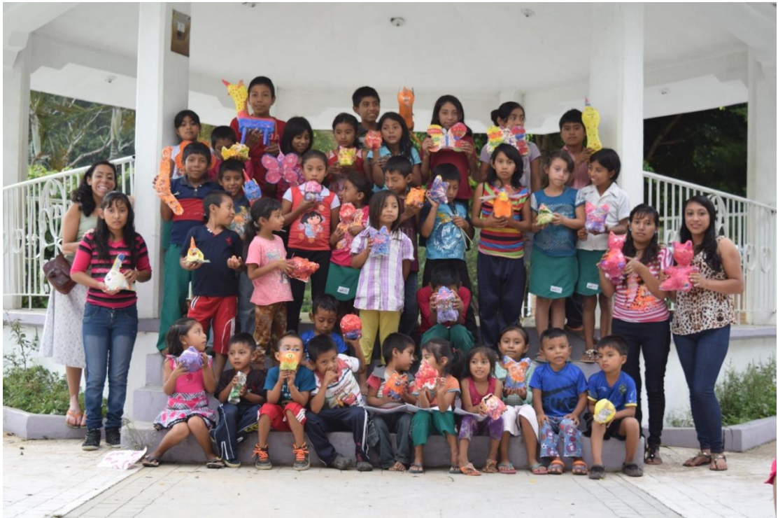
Fig. 9. Exposición final de Alebrijes en el Ejido Josefa Ortiz de Domínguez.