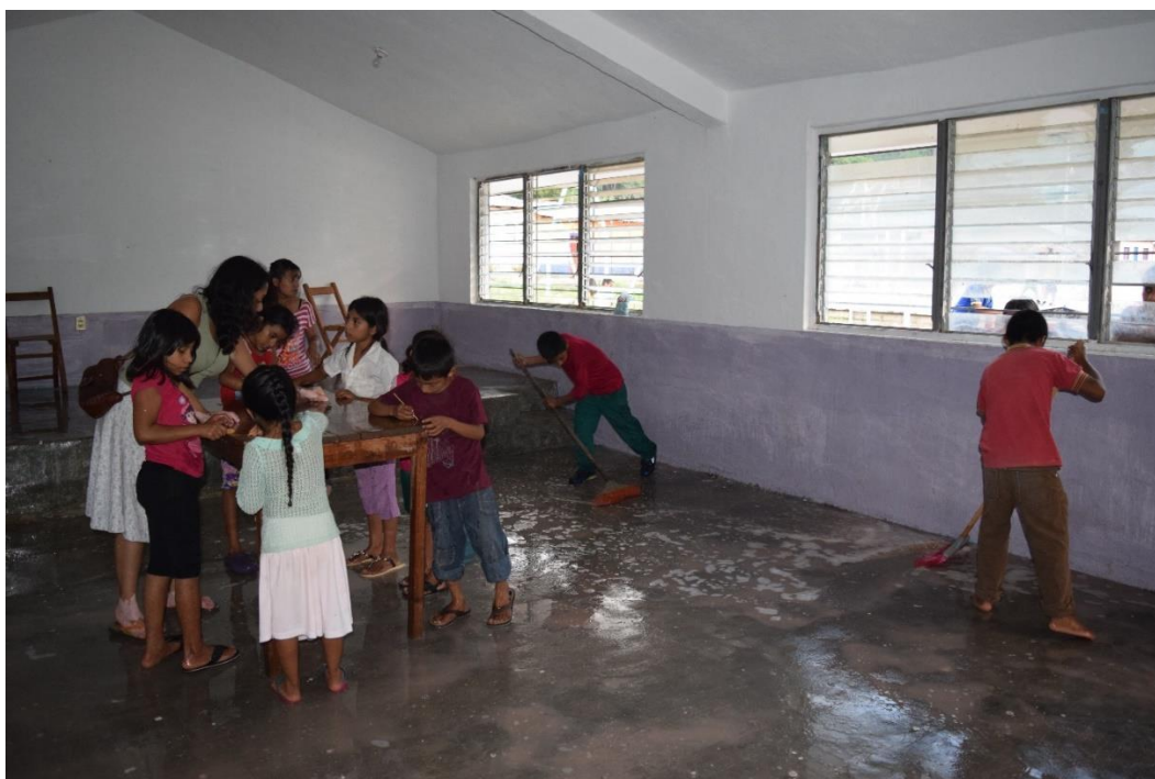
Fig. 8. Trabajo Colectivo de limpieza. Niños y niñas trabajando juntos al término del taller de Alebrijes.