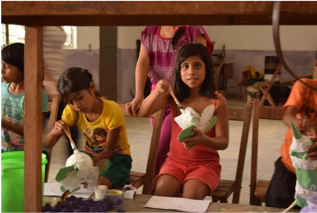
Fig. 6. Segundo día de trabajo. Participantes poniendo color y personalizando sus Alebrijes.

El tercer día por la mañana se pintaron los detalles: boca, ojos, detalles en el cuerpo. Y se realizó el acabado (Fig. 7). Todo estaba listo, después se hizo trabajo comunitario de limpieza de las áreas de trabajo (Fig. 8). Para que finalmente, entre todos organizaran la Exposición Colectiva de los 40 Alebrijes de Josefa en la casa Ejidal, la cual se inauguraría por la tarde. Los participantes observaron las obras de sus compañeros y presentaron de manera voluntaria su pieza (Fig. 9).