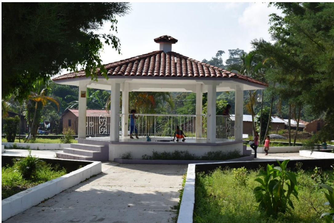
Fig. 3. Quiosco del Ejido Josefa Ortiz de Domínguez, dentro de la Reserva de la Biósfera La Sepultura. Chiapas, México