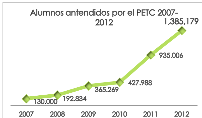
Figura 2. Alumnos atendidos por el PETC 2007-2012 (SEP, 2012b).

Más de la mitad de los directores de las escuelas ETC reportó que, a partir de la puesta en marcha del PECT, aumentó la demanda de alumnos y padres de familia para integrarse a una ETC.