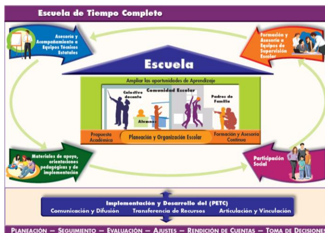
Figura 1. Escuelas de Tiempo Completo (SEP, 2012b).