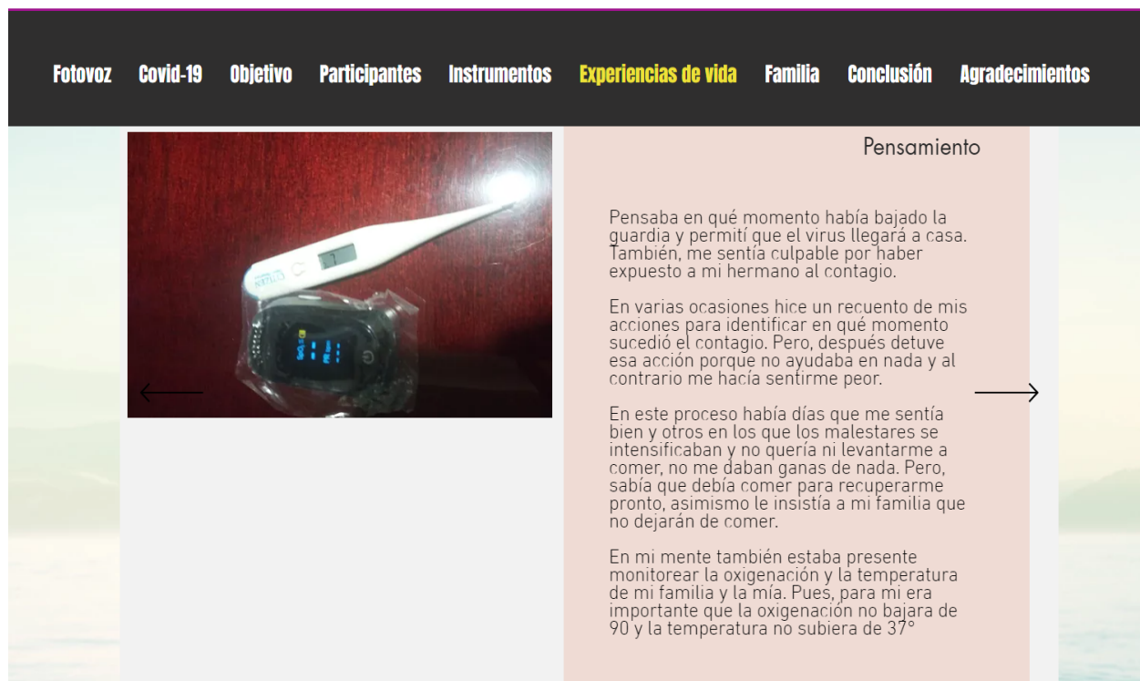
Figura 4. Proyecto “Esto no ha sido fácil. Personal de salud-CDMX”

"Pareciera que nosotros (enfermeras, laboristas, camilleros, limpieza e higiene, asistentes, anestesiólogos y médicos internistas) fuéramos inmunes, al final sólo nos complace cuando los pacientes se van de alta, aunque no sean muchos, pero la persona que se recupera, nos brinda su felicidad y eso es lo único bueno de todo"