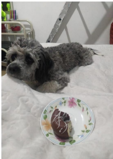
Figura 6. Proyecto “El mundo no se detiene”

Fortalezas: Considero que entre las fortalezas que he aprendido a incrementar, es la responsabilidad y la organización, pues la pandemia cambió muchas cosas que conocía, de un momento a otro debía realizar todo en casa, estudiar, trabajar, socializar y demás, aunque parecía algo mejor pues ya no lidiaba con el tráfico en el transporte, poco a poco fue pesando, pues en lugar de salir de un trabajo e ir a la escuela, se transformó a ir de mi cuarto a la cocina, quizá ya no debía despertar a las 6:00 am para ir a laborar, pero sí a las 9:00, porque sino no terminaría mi trabajo a tiempo y pasaría todo el día trabajando, entonces, perdería la oportunidad de hacer cosas que me gustan. No diré que ha sido fácil organizarme y ser persistente en ello, sin embargo, creo lo he ido perfeccionado, ahora ya tengo tiempo para pasar con quienes quiero, para acostarme y descansar tanto física como mentalmente, además, he aprendido a hacer las cosas de una forma diferente, por ejemplo, hacer ejercicio con una escalera para desestresarme, jugar con mis bendis (mis perros), e incluso para tener videollamadas entre semana con mis amigos. Elegí esta foto porque es de las últimas imágenes que tengo en el día, para mi simboliza la recompensa a mi esfuerzo en mi jornada, es como un apapacho y momento de relajarme.