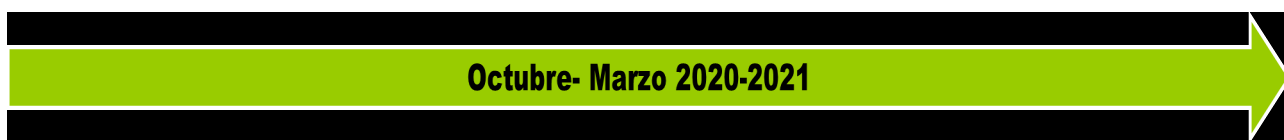
Figura 2. Ruta general de la propuesta