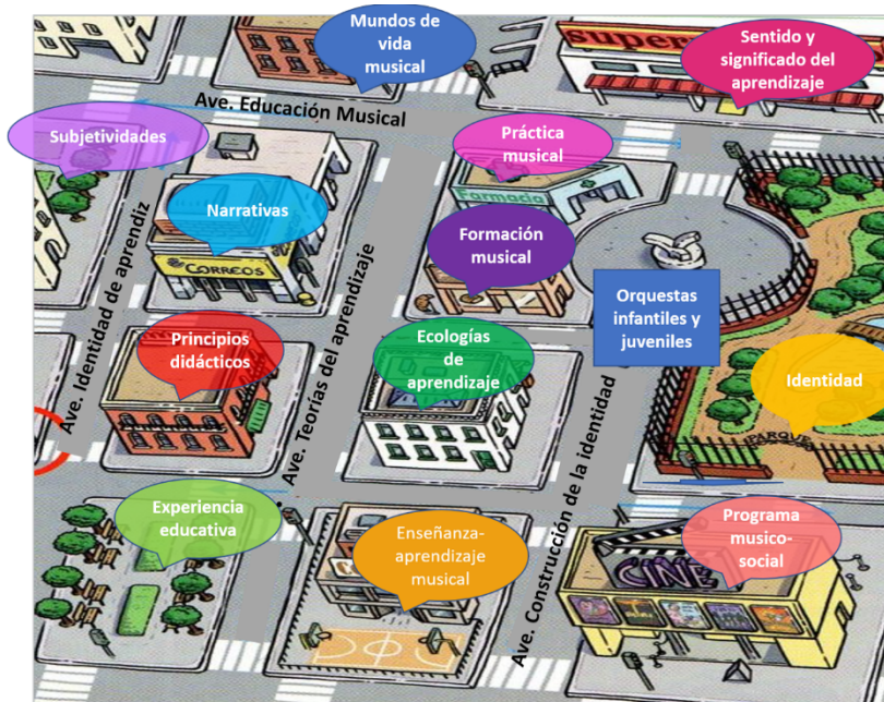
Figura 8. Cartografía general. Ciudad “Orquestas infantiles y juveniles en México: un acercamiento a las identidades narrativas de estudiantes y docentes. (Ortiz Cortés, 2021).

Cartografía general de las categorías en la ciudad de conceptos