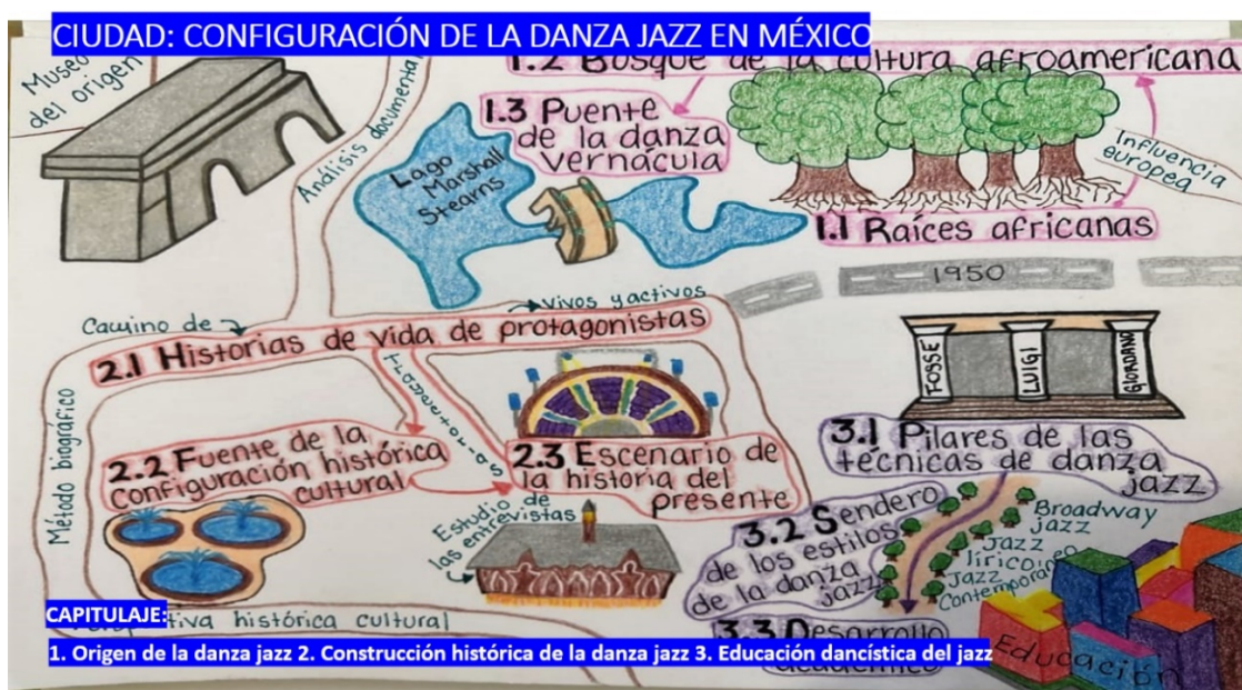
Figura 6. Cartografía general. Ciudad “Configuración de la danza jazz”. (Sánchez Herrera, 2021).

Después de las matrices, se elaboró la cartografía y tres itinerarios categoriales. Las siguientes dos imágenes (figuras 6 y 7), presentan la cartografía general y uno de los itinerarios categoriales del trabajo de danza.