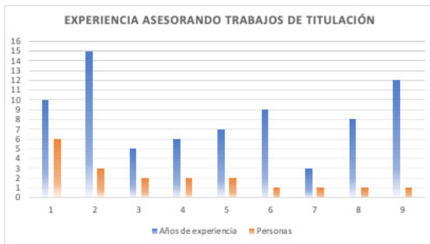
Figura 1. Experiencia de los docentes en asesoría de titulación

Un segundo elemento que nos permite indagar en el perfil de los profesores es conocer cuántos asesorados atienden de esta generación. Se observa que la mayoría atiende a cinco o más, resaltando el caso de un profesor que tiene 13 alumnos asignados. El resto diversifica sus horarios en actividades como la docencia, gestión, investigación y asesoría de trabajos. La asesoría de cada alumno equivale a una hora semanal del horario que cubren en el plantel.